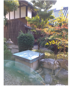
現在も残る三ヶ所の内の二ヶ所の井戸