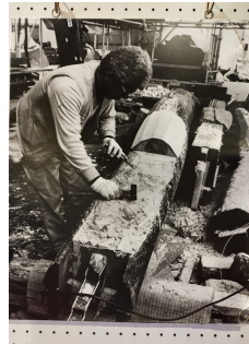
半解体修理の際の修復の様子

・重要文化財は、解体修理の際もできるだけ元の材料を使います。「重要文化財旧杉山家住宅修理工事報告書」にも「蟻害により腐朽していたので、鉄骨補強、ウレタン樹脂、により補修し、取付けた」と記載されています。