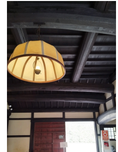
吊り行灯の架かっている修復された梁

問4 「座敷と奥座敷間にある透かし彫りの欄間、そこにデザインされている花は…？」